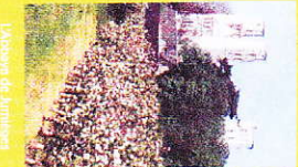
Visiteurs de Juntièges